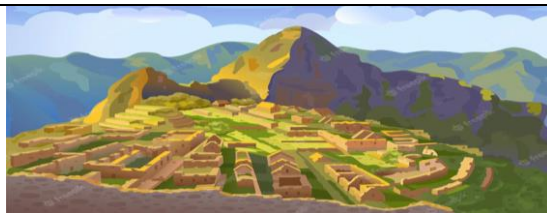
P _____ (V _____)